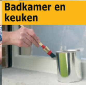
Perfect over- schilderbaar