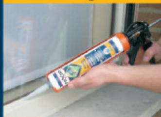
Opspuiten van glas